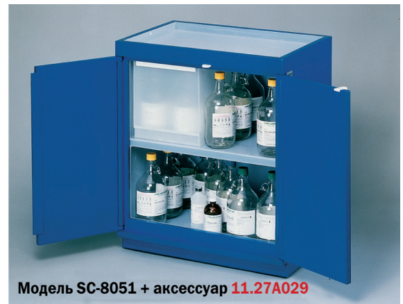
Модель SC-8051 + аксессуар 11.27A029

Модель PS-5030 изготовлена с нижним цоколем для размещения прямо на полу, идеальна для централизованного хранения.