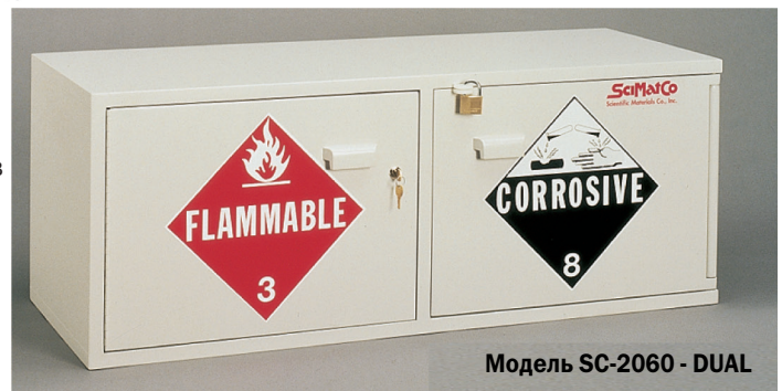
Модель SC-2060 - DUAL