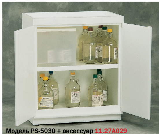
Модель PS-5030 + аксессуар 11.27A029